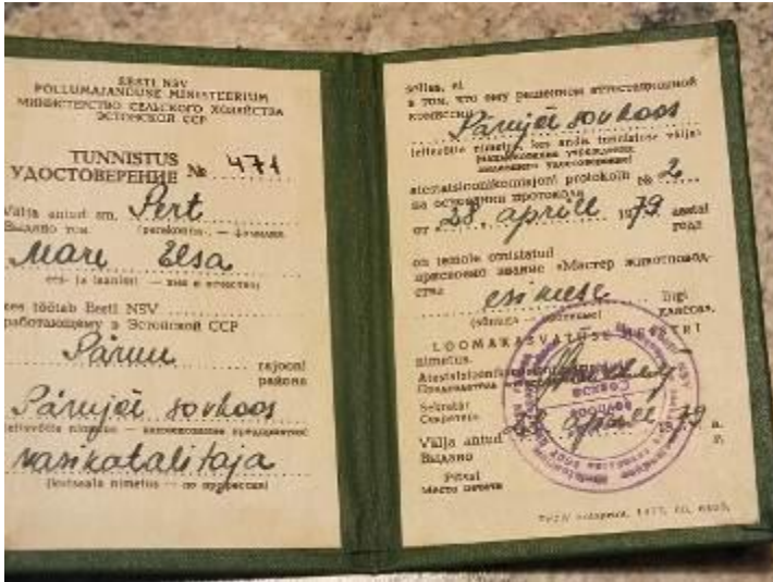
Esimese liigi loomakasvatuse meistri tunnistus 1979. a.