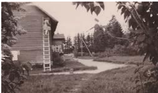
Vanaema Võiera koolimaja seina puhastamas.