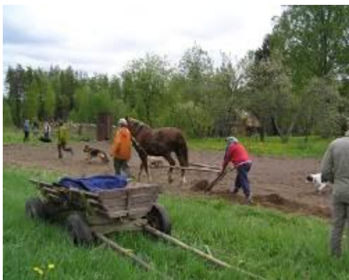
Vagude ajamine hobuse ja sahaga.

Minu vanaema ja vanavanaema kasvasid kogu aeg ise lehmi, lambaid, kitsesid ja kanu. Saadud toodang läks oma pere tarbeks ja veidi viidi ka kooli. Aiamaal kasvatati juurvilju. Kartulimaad hariti traktoriga, vaod aeti sisse hobuse järel veetava sahaga. Põhiline töövahend oli hobune, kes laenati naabertalust.