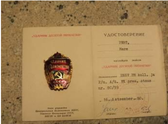
Viisaastaku võitja 1980. A.