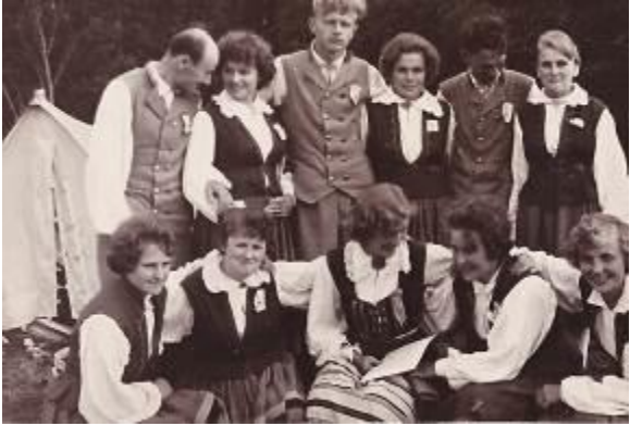
Vanaema koos rahvatantsurühmaga (tagareas keskel).