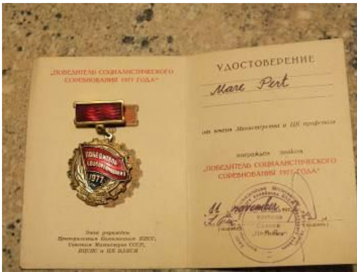
Sotsialistliku võistluse võitja 1977. a.