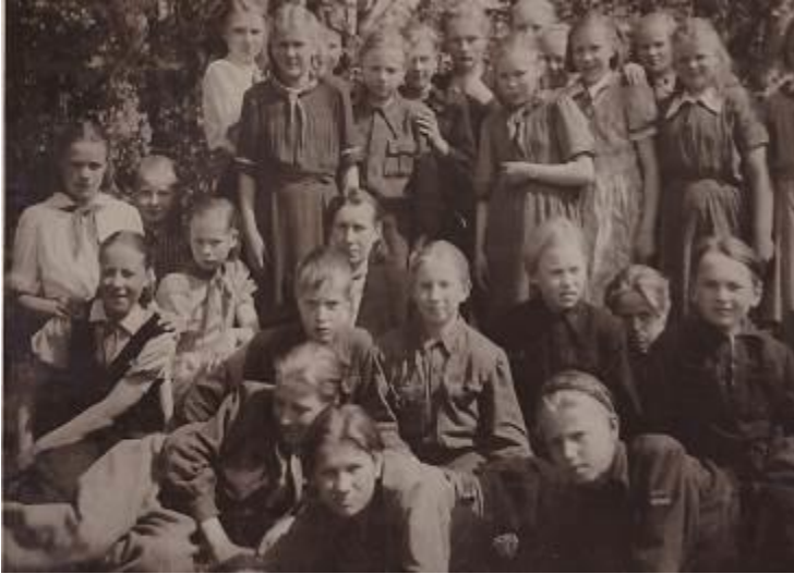
5.-6. klassi pioneerid

Koolis kandsid tüdrukud pihikseelikut või kleiti ja jalas sukki. Ühist koolivormi ei olnud. Kõik noored pidid astuma pioneeriks ja kandma punast kaelarätti.