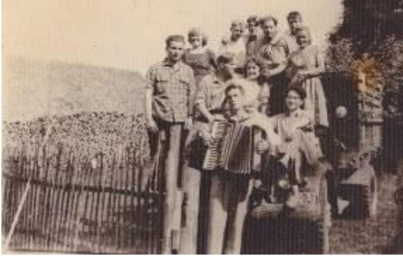
Noored lustimas pillimängu saatel.

Vanaema noorpõlves toimusid sageli noorte kogunemised, kus mängiti pilli ja lauldi. Kino näidati koolimajas ning pärast kino toimus noorte tantsuõhtu ikka elava muusika saatel. Pillimehed olid alati hinnatud.