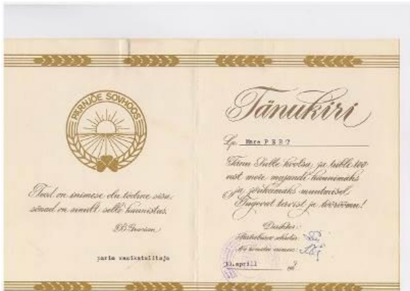
Parim vasikatalitaja 1987. a.