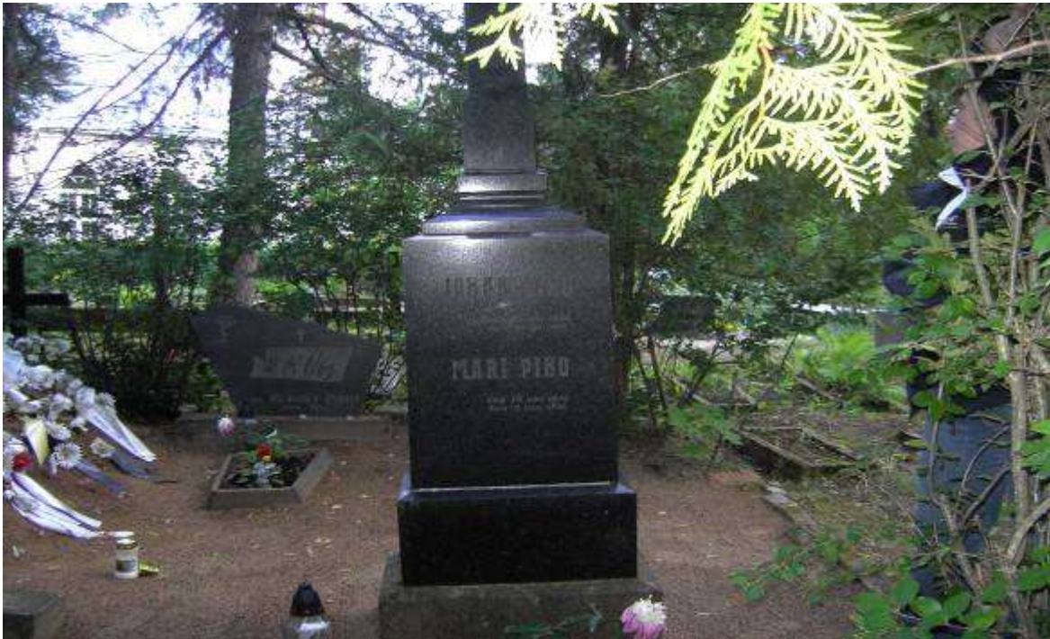
Perekond Piho hauaplats Pindi Jaani kalmistul. 12