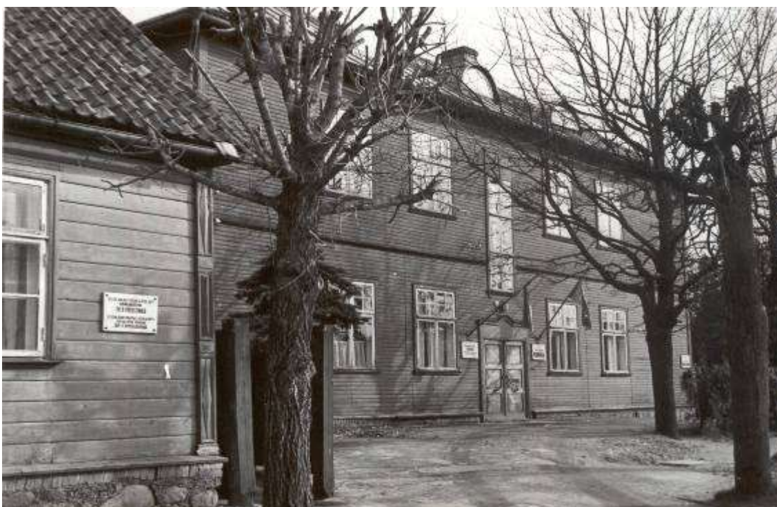
Võru linnahaigla hoone, mis valmis 1933. aastal. Fotograaf M. Pakler 1988. aastal 23

Hoone alumisel korrusel oli viis palatit, arstituba, kontor ja abiruumid, ülemisel korrusel neli arstituba, kaks operatsioonisaali, arsti korter ning ravikabinet ja röntgenikabinet. Haigla juurde kuulus ka bakterioloogia laboratoorium. Kogu hoones oli veevõrk sooja ja külma veega. See haiglakompleks töötas kuni 15. maini 1982. a, mil avati uus haiglahoone Kubijal. 22