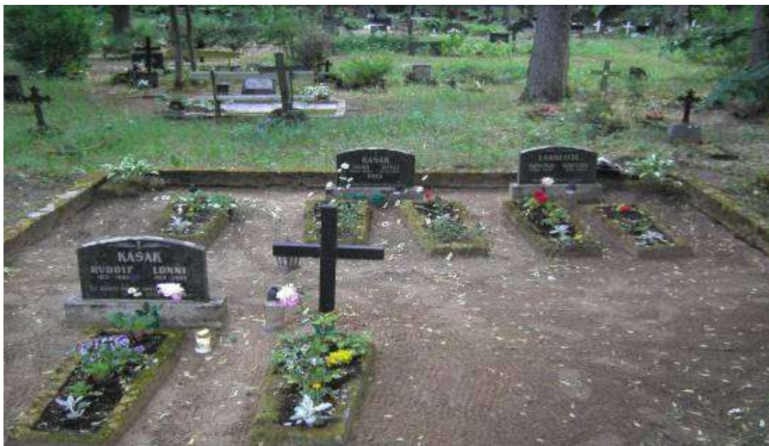
Perekond Kasaku hauaplats Pindi Jaani kalmistul. 19.06.2011 14