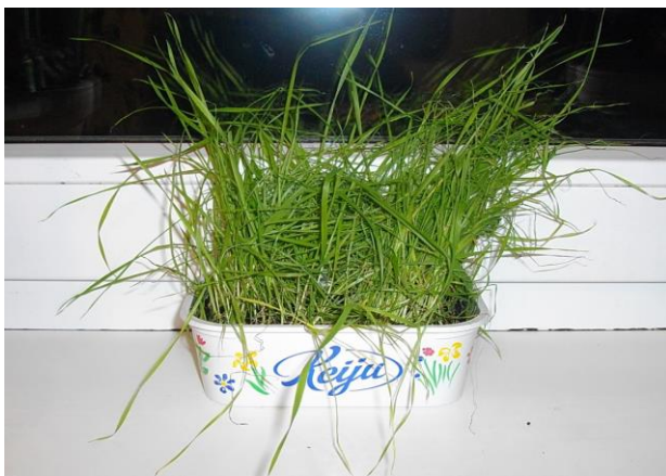
Foto 2. Müru katse 3