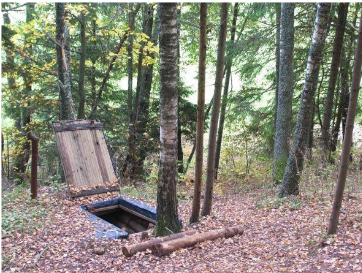
Foto 10. Sissekäik maa-alusesse punkrisse Metsavenna talus, Vastse-Roosa külas.

Metsavendade elukohaks metsas oli punker (foto 10). Mitte keegi peale nende, kes punkris elasid, ei tohtinud teada punkri asukohta. Ainult nii oli selles punkris elamine kindlustatud, seniks kui keegi juhuslikult või metsavendi otsides punkri juurde sattus.