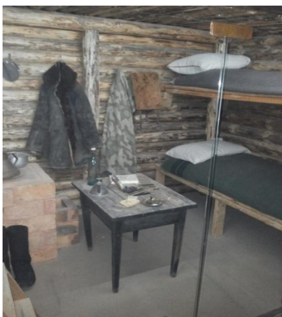
Foto 11. Metsavendade punkri rekonstruktsiooni sisevaade Võrumaa Muuseumis. (Karel Kuus, 2017)

Maa-aluseid punkreid ehitati nii suuremaid kui ka väiksemaid, kuid tavaliselt olid punkrid mõeldud paarile mehele. Selline punker tähendas rünnaku korral küll surmalõksu, kust polnud võimalik väljuda, kuid samas oli seda äärmiselt raske avastada. Punkrid maskeeriti põhjalikult. Hoolikalt tuli maskeerida ka suitsutoru, mis võis punkri asukohta reeta. Mõnel punkril olid isegi laudadest seinad ja põrand. See aitas neid natuke kuivemad hoida, sest muidu kippus vesi kevadel punkrisse imbuma. Tavaliselt koosnes punker kahest ruumist – ühes hoiti toiduvarusid ja teine oli eluruumiks, kus asusid narid (foto 11 ja 12).