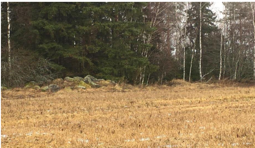
Foto 4. Maristu talu nõukogude võimu ajal maaparandustööde käigus metsa äärde lükatud vundamendikivid. (Karel Kuus, 2017).