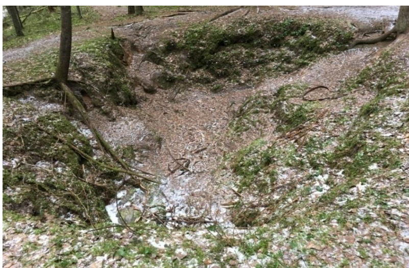
Foto 15. Taevaskoja punkrist on säilinud suur auk. (Karel Kuus, 2017).

Jaan Rootsi Taevaskoja punker lasti hävituspataljonlaste poolt õhku 1954. aastal. Praeguseks on punkrist säilinud ainult suur auk metsa all (foto 15).