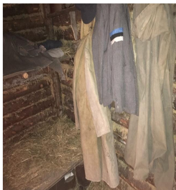
Foto 12. Metsavendade punkri rekonstruktsiooni sisevaade Eesti Sõjakuuseumis Viimsis. (Karel Kuus, 2017)

Punkrites elati nii suvel kui talvel. Talvel oli punkrites üksluine elada, väljas käidi vaid erandkorras, sest jäljed oleks reetnud punkri asukohta. Maapealsed punkrid olid ehitatud võimalikult maa ligi, et neid oleks raskem märgata. Nende alumine osa oli seetõttu tihti kaevatud maa sisse. Eriti heaks materjaliks osutus turvas, mis külmudes jääkõvaks muutus ning ühtegi kuuli läbi ei lasknud. Oli punkreid, kuhu oli rajatud tornilaadne ehitus, kust igast suunas tuld võis anda. Punkri seintes olid laskeavad (Võrumaa Koduloo Muuseum, Eesti Sõjakuuseum).