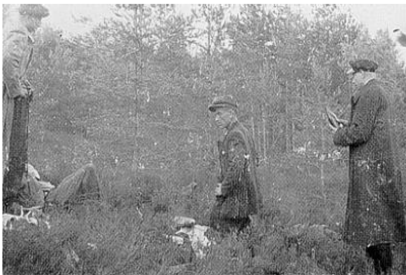
Foto 7. Jaan Roots (keskel) kuulsa grupi „Orion“ juhina Vastseliina vallas Võrumaal (VK 5086: 6, lk 18)

Metsavendadel puudus jõud küüditamisaktsiooni peatamiseks. Mõnel pool üritasid metsavennad rikkuda raudteed, rünnati küüditamisel osalevaid nõukogude aktiviste. Tuhandeid inimesi hoiatati metsavendade poolt eelseisvast küüditamisest ning nad jõudsid varjuda. Metsad täitusid inimestest, kellel polnud enam midagi kaotada. Paljude pered olid saadetud Siberisse, nad olid kaotanud elus kõik – nii kodu kui ka omaksed. Üle jäi vaid kättemaks. „Parem surm siin kui Siberis“ muutus metsavendade tegevuse kandvaks loosungiks. (Laar, 2005, lk 36–37)