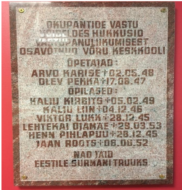
Foto 23. Mälestustahvel Võru Kreutzwaldi Koolis. (Karel Kuus, 2017).