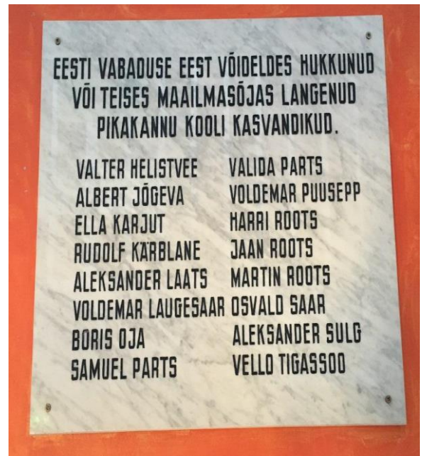
Foto 24. Mälestustahvel Jaan Rootsile Pikakannu koolis. (Karel Kuus, 2017).