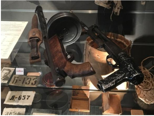
Foto 8. Näide metsavendade relvadest Okupatsioonide Muuseumist Tallinnas. (Karel Kuus, 2017)