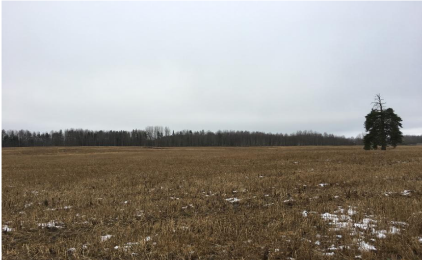
Foto 3. Maristu talu maa, suure männi juures asus Rootside talumaja..