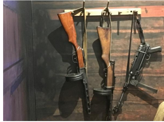
Foto 9. Näide metsavendade relvadest Eesti Sõjamuuseumis, Viimsis.