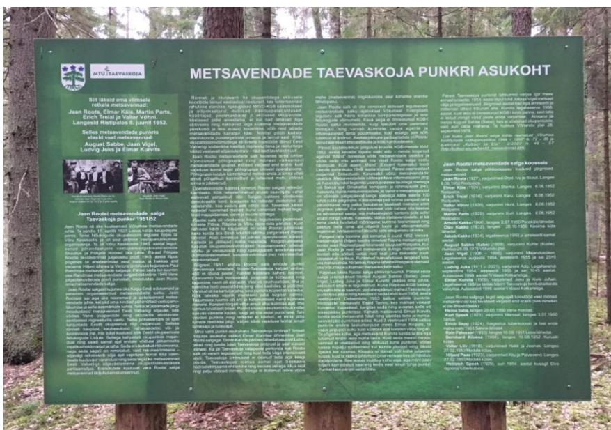
Foto 16. Infotahvel Taevaskojas Jaan Rootsi punkri juures.

MTÜ Taevaskoja liikmed avasid 28. juunil 2010. aastal Jaan Rootsi metsavendade salga punkri juures infotahvli, mis annab ülevaate seal elanud vastupanuvõitlejatest (foto 16). Samuti on paigaldatud viidad, et punkri asukoht oleks lihtsalt leitav.