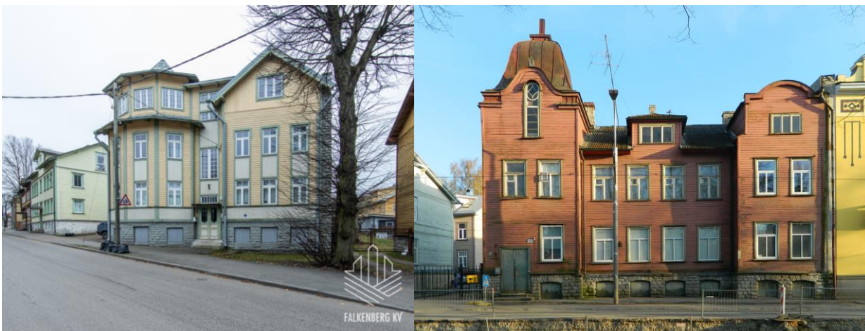
Joonised 2 ja 3. Uus-Kalamaja 11 ja A. Weizenbergi 10 elumud